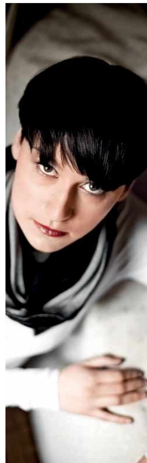
Haare & Make-up Groha-Kreativ-Team ::: Leitung Stephanie Meckl